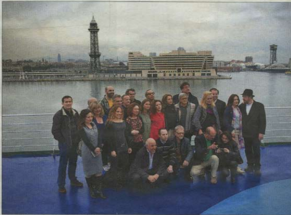
Los escritores de La nave de los libros , ayer en la cubierta del barco al llegar a Barcelona.

Que pocos pasajeros de un crucero suban a cubierta para pasear o tomar el sol en una travesía de casi un día no es frecuente, aunque ayer el cielo plomizo que cubrió la autopista marítima de Roma a Barcelona invitaba poco a ello. Pero mucho menos frecuente es que los pasajeros de un navío, aunque sea de ruta regular entre dos ciudades, paseen por los diversos niveles de puentes con un libro bajo el brazo, que discutan sobre la obra de un escritor en los salones de descanso o las cafeterías, que festejen los versos de un poeta con ansias de más poesía recitada sin echar ojo al reloj en plena hora del al-